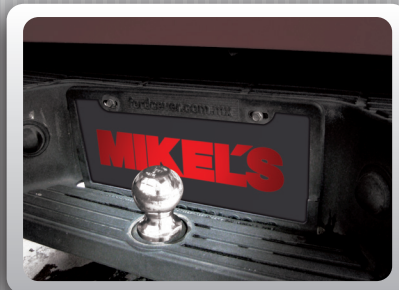
INSTALACIÓN EN LA DEFENSA

IDEAL PARA INSTALARSE EN LA DEFENSA O LENGÜETA