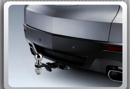
INSTALACIÓN EN LA LENGÜETA INVERTIDA