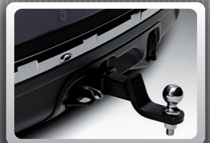
INSTALACIÓN EN LA LENGÜETA